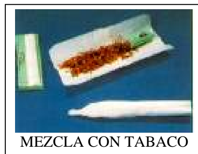
MEZCLA CON TABACO