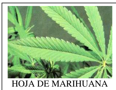
HOJA DE MARIHUANA