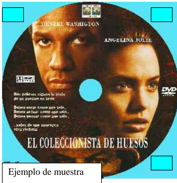
Ejemplo de muestra